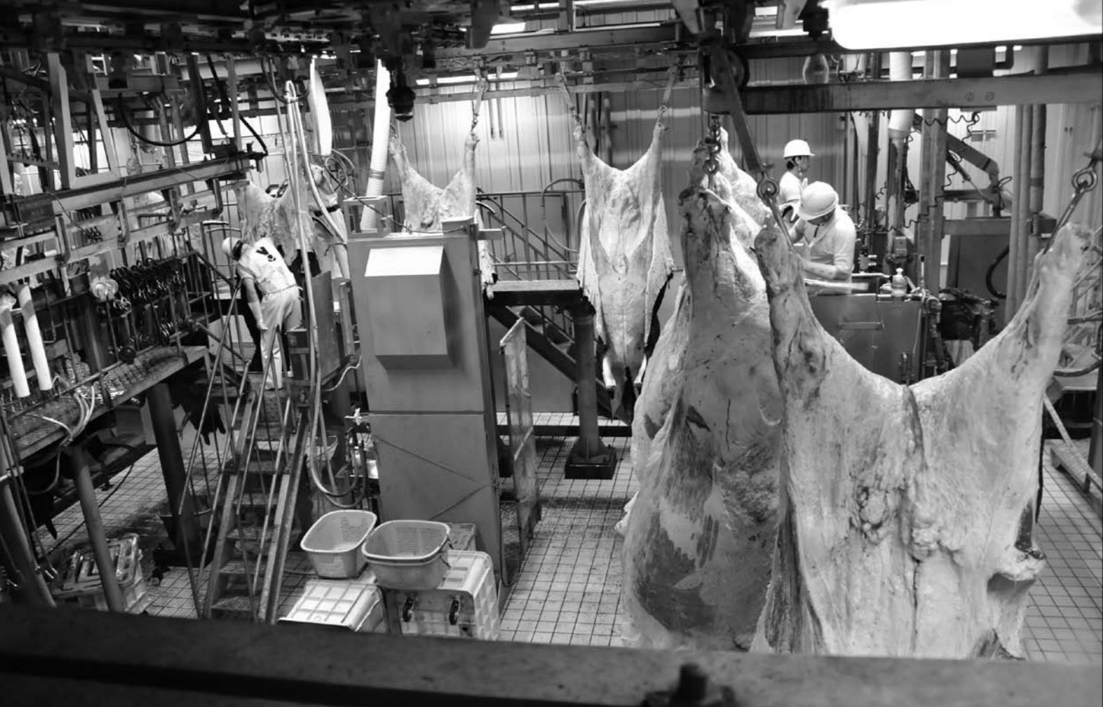
屠殺された牛は皮を剥かれ、内臓を摘出してから「背割り」を行ない、枝肉にされていく。坦々とスピーディーに手際よく作業が進む。事前申し込みをすると、窓越しに見学もできる(北海道畜産公社十勝工場)