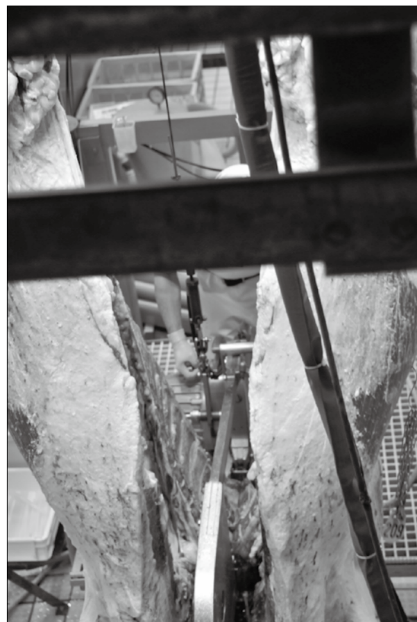
手際よく背割りされ、枝肉になる瞬間

道北の名寄市立食肉センターは、 昨年の改築オープンを機に飲用水設 備を新設した。ここでは、委託先の 二子口畜産が乳用の廃用牛を中心に 受け入れ、屠殺後はミンチや精肉な どにする。旧屠畜場の大部分を繋留 所に改修し、最大80頭ほどの牛を収 容できる(豚は扱っていない)。 上川管内でも豚流行性下痢が発生 したこともあり、わたしが予定した