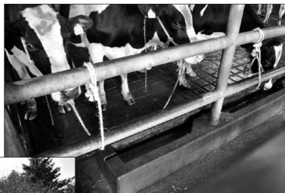
▲せっかく整備されても使われない繋留所の飲用水設備(下の細長いスペース)。前日に搬入され、水を飲むことなく屠殺される牛も

人間の生活のために尽くした家畜が最期のときを迎える屠畜場では、屠殺や解体処理が日々と行なわれていた。だが、一般市民が訪れる機会は少なく、動物たちがどのように生涯を終えるのか知らずにいる人も多い。すでに9年前には食用目的の屠殺に関する国際的なガイドラインが策定されており、アニマルウェルフェア(家畜福祉)を推進するために、屠畜場のあり方を改善していくことが急務になっている。このシリーズの第4回は、屠畜場の飲用水設備の実態を調査した獣医師たちの取り組みや、給水によって枝肉格付や行動に好影響を与えるとの結論を得た研究成果などを紹介し、屠畜場のあるべき姿を探った。