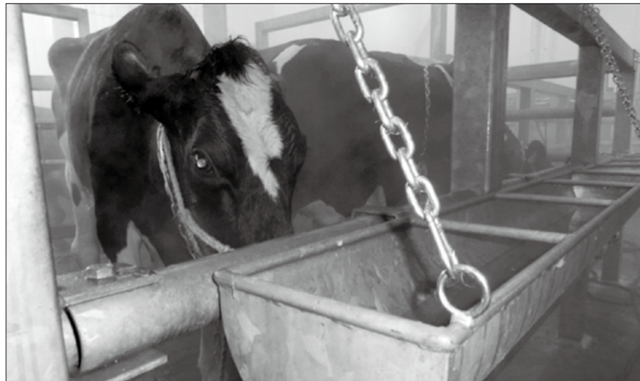
昨年、移動式の水槽が設置された名寄市立食肉センターの繋留所

「今後、新設される屠畜場 には設置されるでしょうが、 既存施設については、構造 基準にないものを設置する よう指導するのは難しい。 事業者の自主性に委ねるし かありません。OIEのガ イドラインや獣医師の調査 結果(前出)などの積み重ね によって、変えていくよう